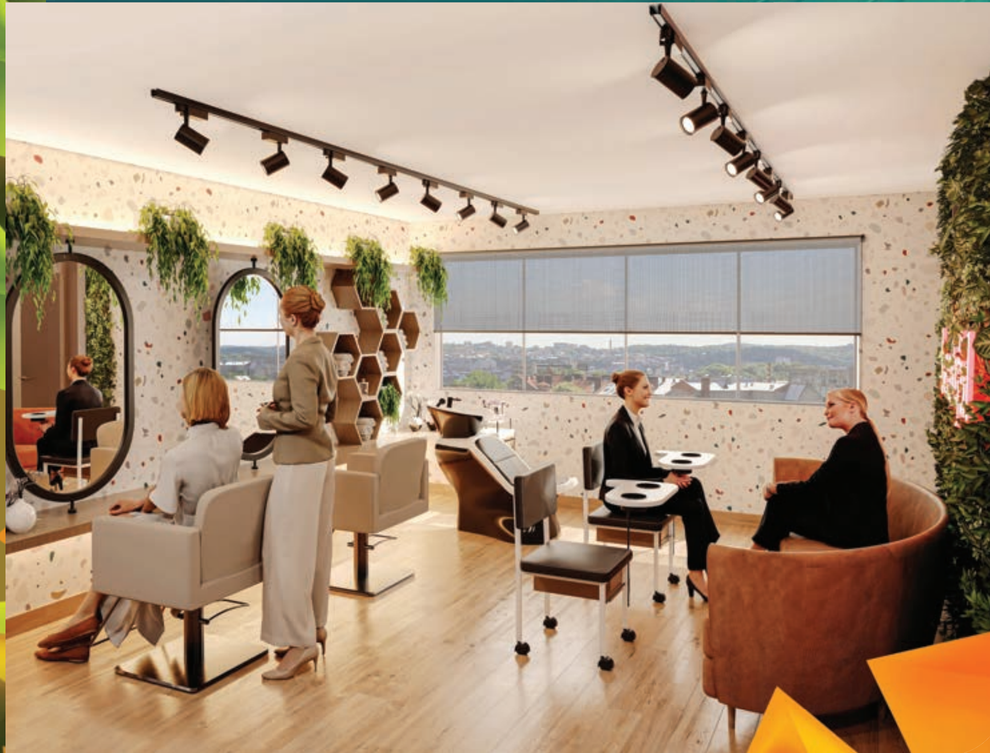
PERSPECTIVA MERAMENTE ILUSTRATIVA DO ESPAÇO MULHER* VIDE TEXTO LEGAL.

SEU BEM-ESTAR A QUALQUER MOMENTO, TODOS OS DIAS.