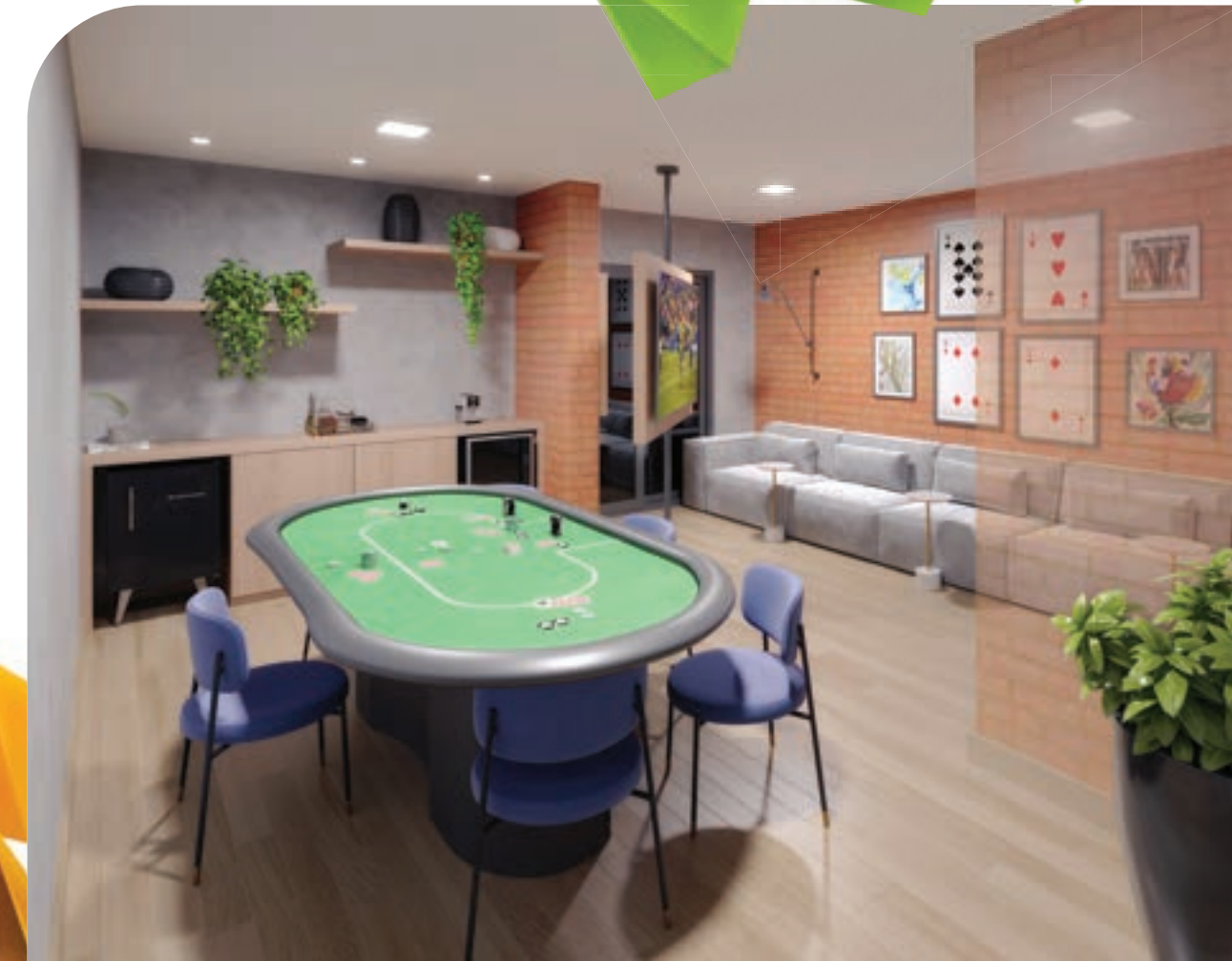
PERSPECTIVA MERAMENTE ILUSTRATIVA DO LOUNGE.* VIDE TEXTO LEGAL.

AMBIENTES DIFERENTES PARA UMA VIDA MAIS COMPLETA E ANIMADA.