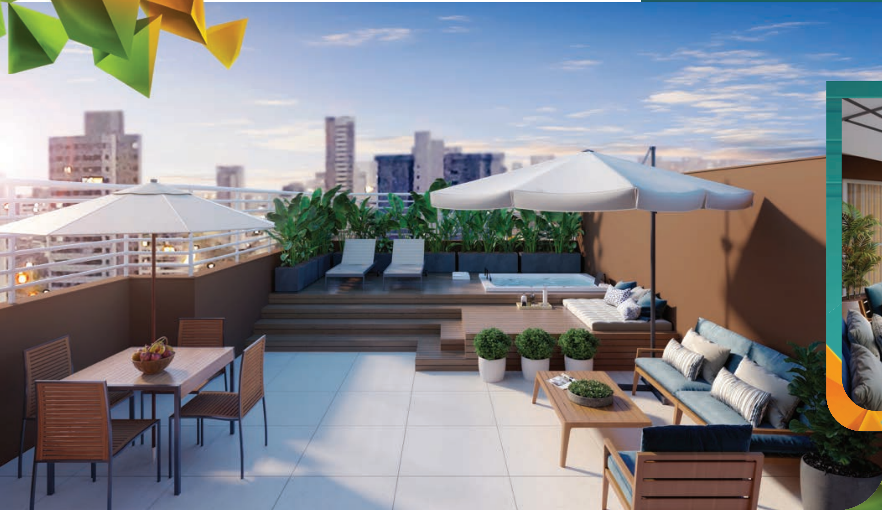
PERSPECTIVA MERAMENTE ILUSTRATIVA DA VARANDA DA COBERTURA. * VIDE TEXTO LEGAL.