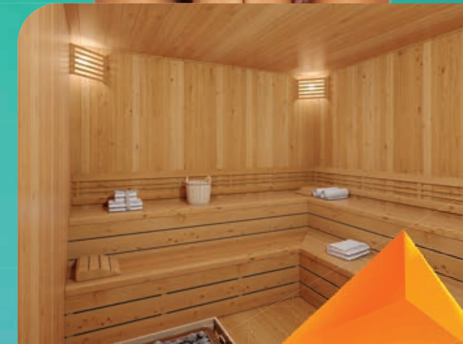
PERSPECTIVA MERAMENTE ILUSTRATIVA DA SAUNA.* VIDE TEXTO LEGAL.