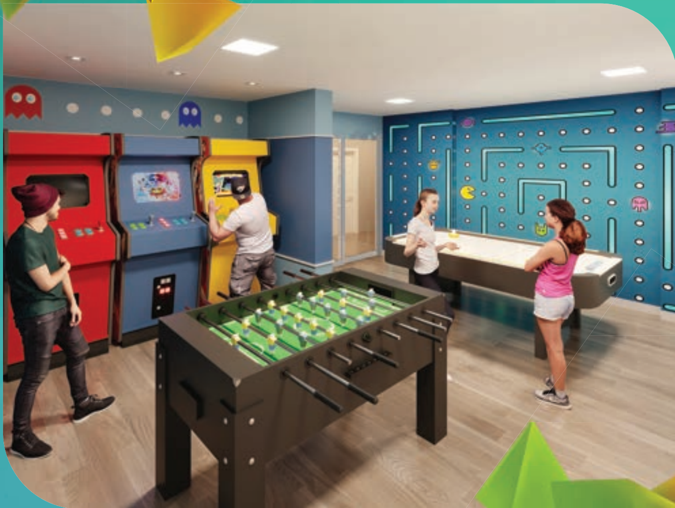
PERSPECTIVA MERAMENTE ILUSTRATIVA DO SALÃO DE JOGOS.* VIDE TEXTO LEGAL.

DIVERSÃO NÃO TEM IDADE, TEM MÚLTIPLOS ESPAÇOS.