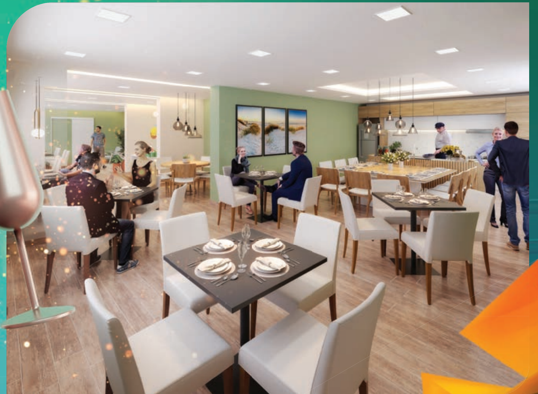
PERSPECTIVA MERAMENTE ILUSTRATIVA DO SALÃO DE FESTAS.* VIDE TEXTO LEGAL.