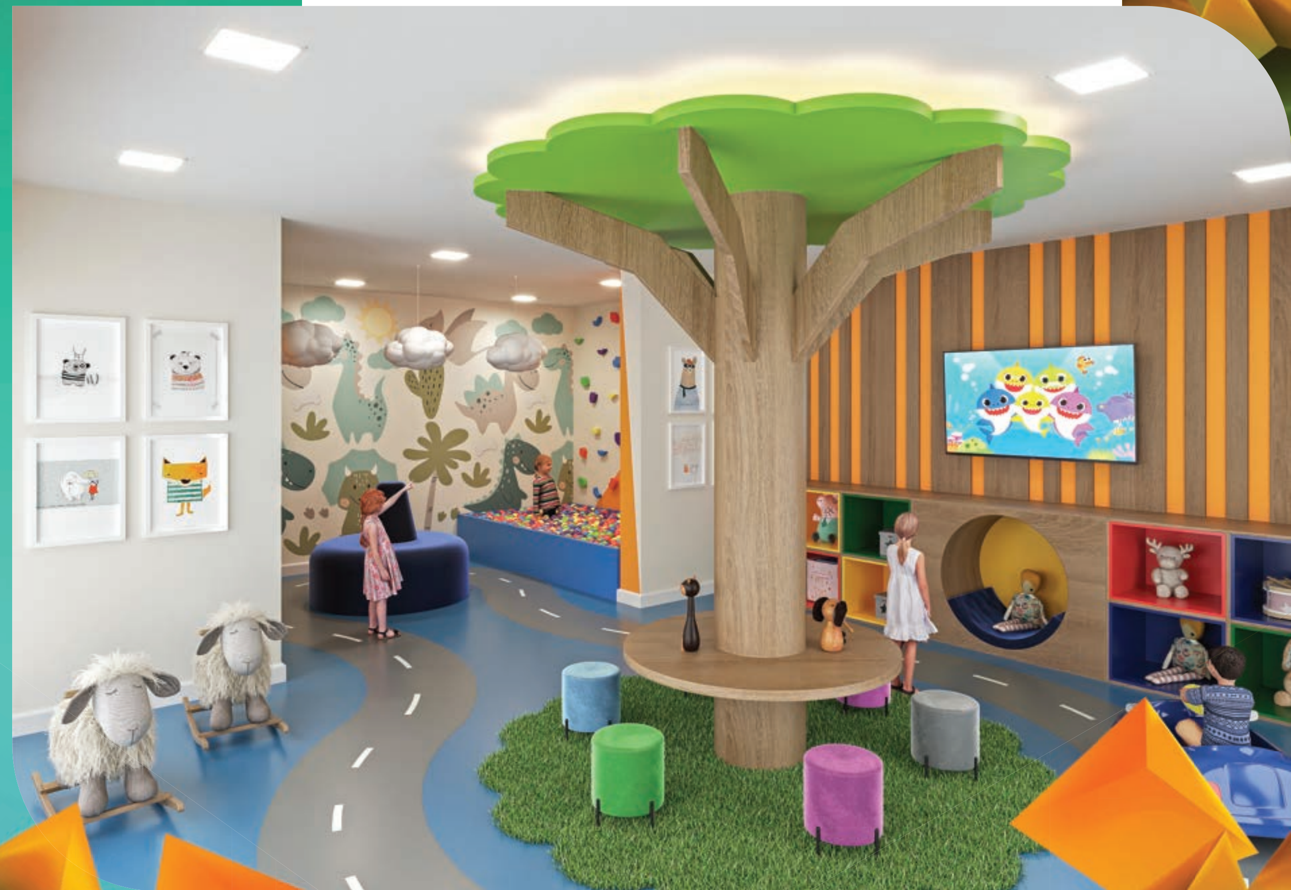
PERSPECTIVA MERAMENTE ILUSTRATIVA DA BRINQUEDOTECA.* VIDE TEXTO LEGAL.