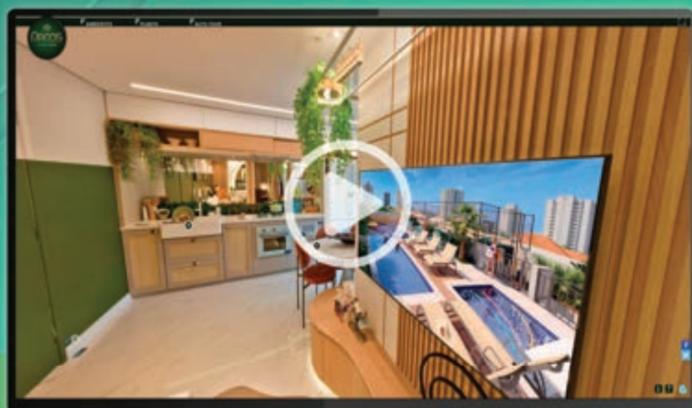
Decorado 2 Dorms. 42m 2