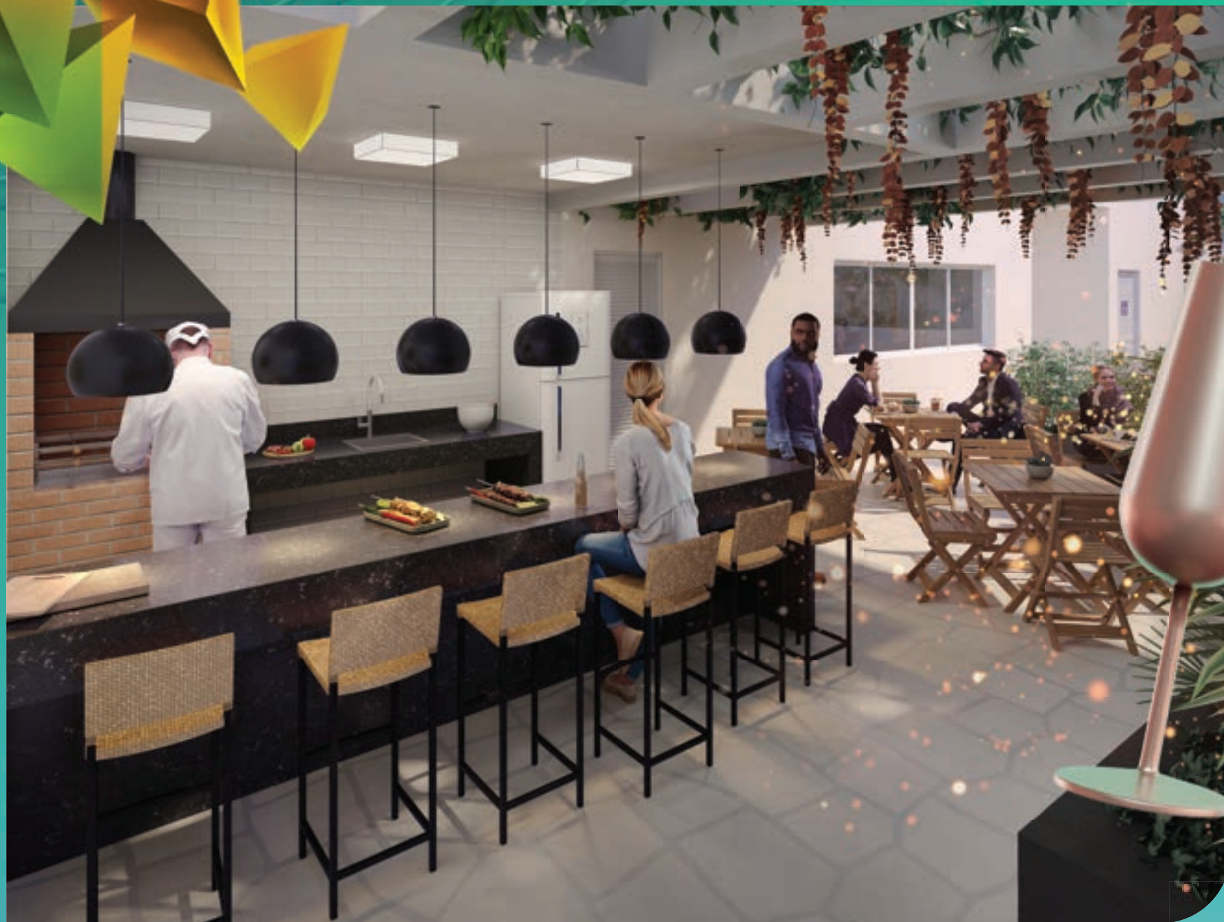
PERSPECTIVA MERAMENTE ILUSTRATIVA DA CHURRASQUEIRA.* VIDE TEXTO LEGAL.