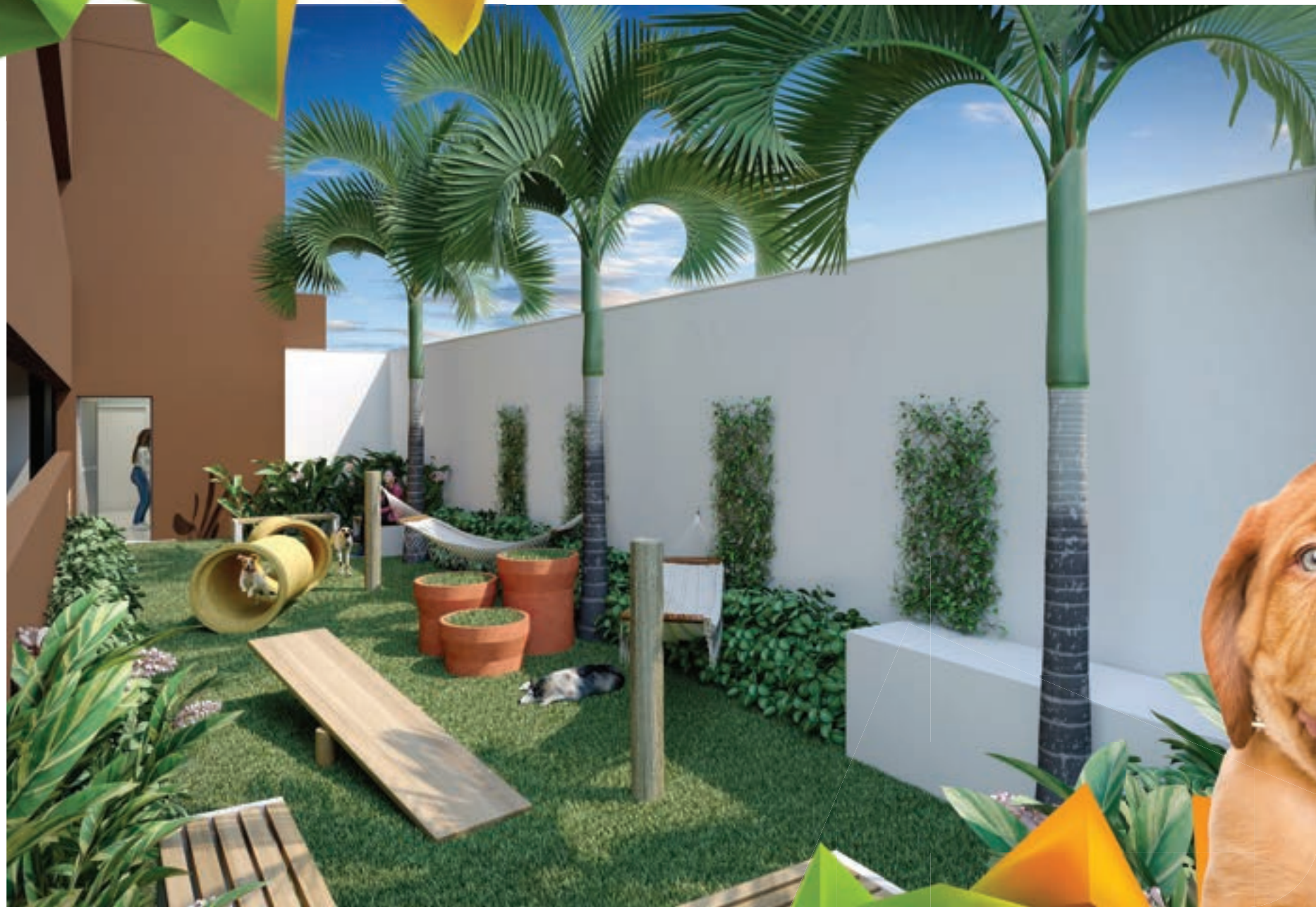
PERSPECTIVA MERAMENTE ILUSTRATIVA DO PET PLACE.* VIDE TEXTO LEGAL.