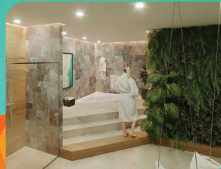
PERSPECTIVA MERAMENTE ILUSTRATIVA DO SPA.* VIDE TEXTO LEGAL.