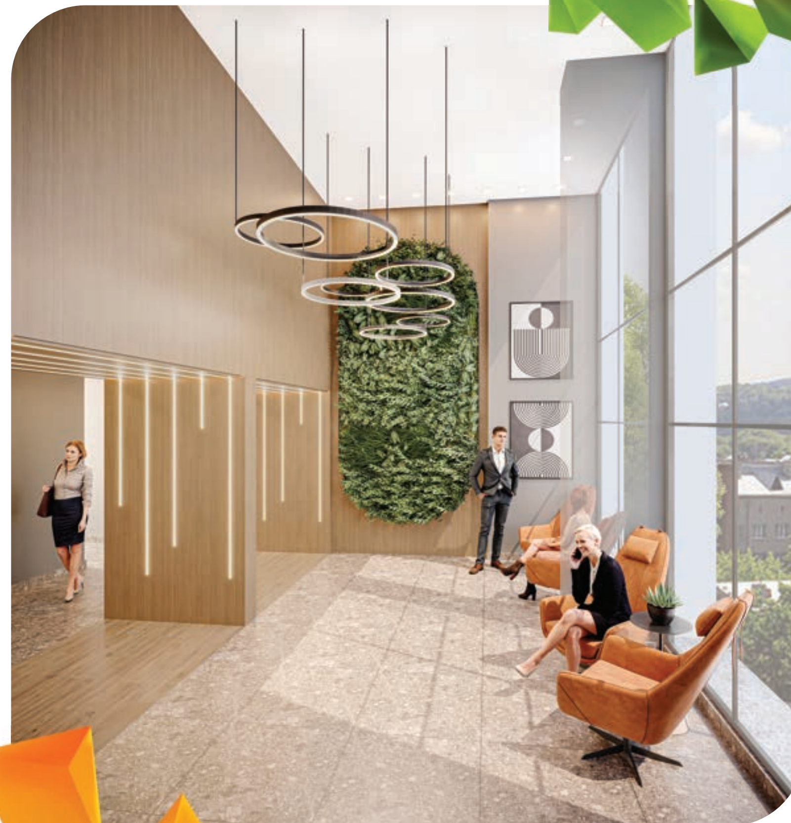
PERSPECTIVA MERAMENTE ILUSTRATIVA DO LOBBY. VIDE TEXTO LEGAL.