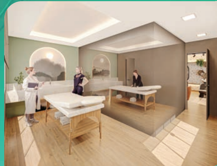
PERSPECTIVA MERAMENTE ILUSTRATIVA DA SALA DE MASSAGEM.* VIDE TEXTO LEGAL.