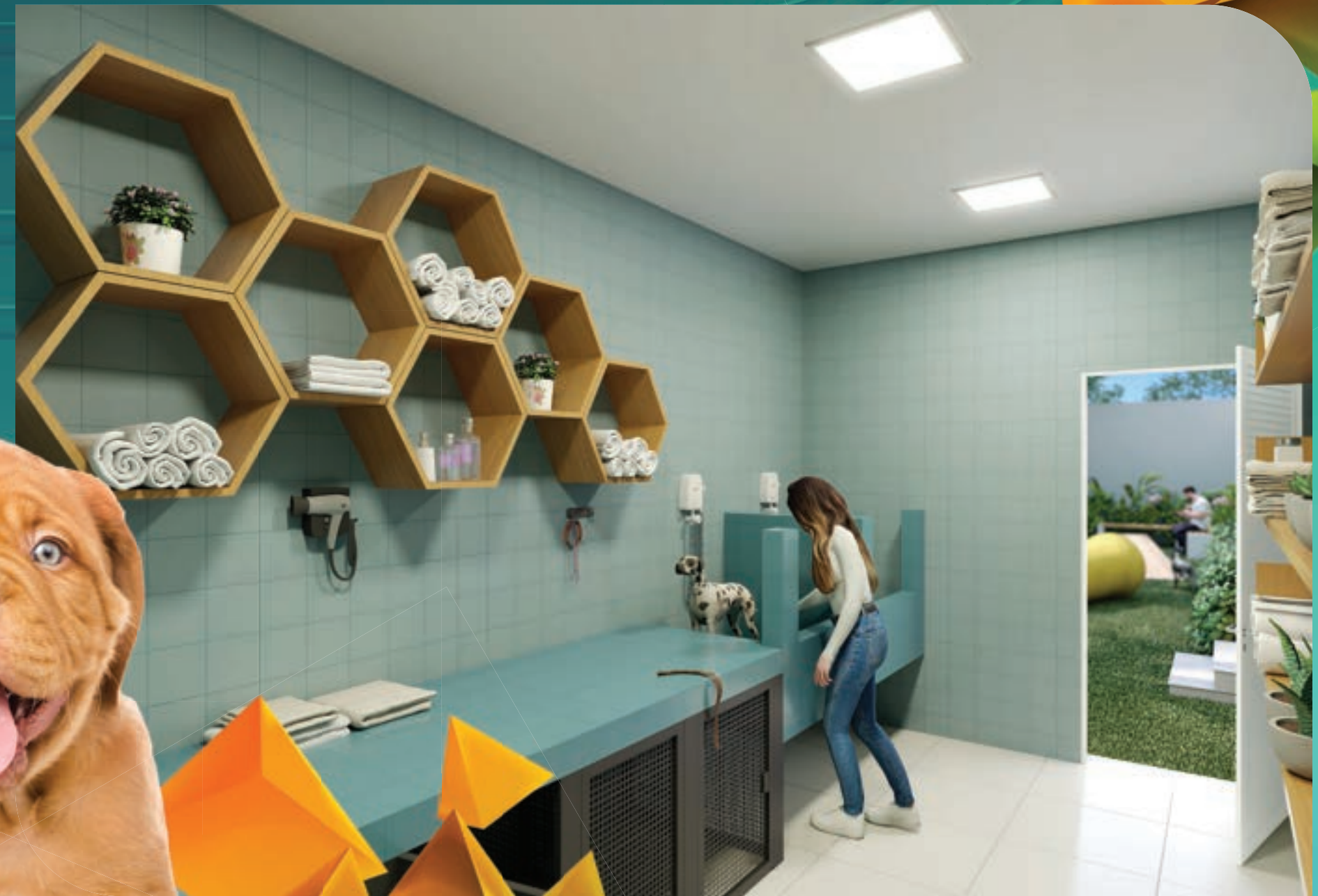
PERSPECTIVA MERAMENTE ILUSTRATIVA DO PET WASH.* VIDE TEXTO LEGAL.