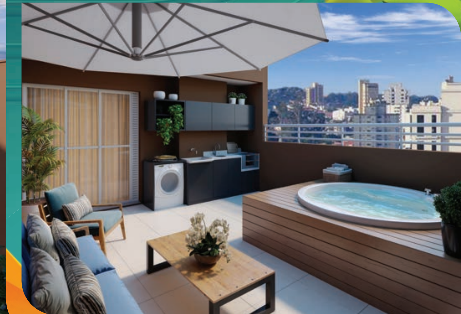
PERSPECTIVA MERAMENTE ILUSTRATIVA DA VARANDA DA COBERTURA. * VIDE TEXTO LEGAL.