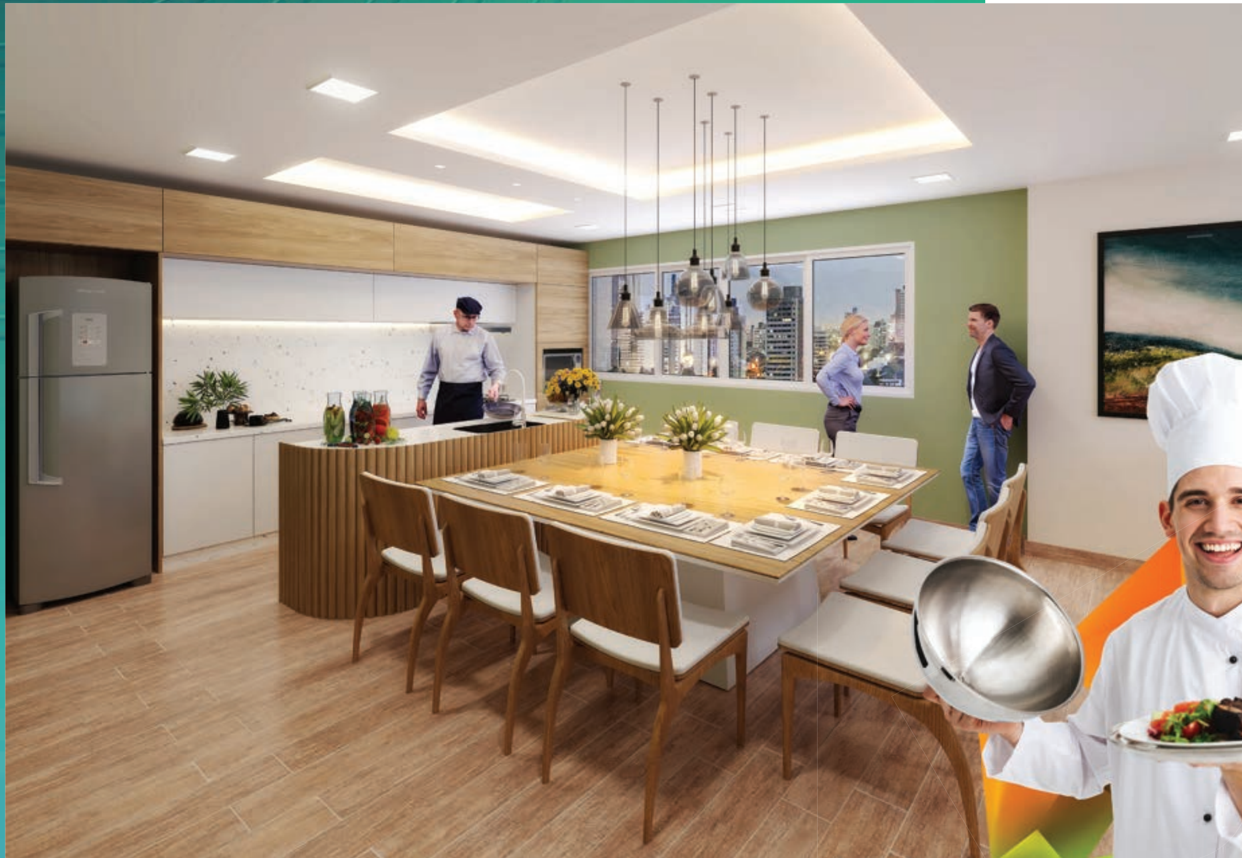
PERSPECTIVA MERAMENTE ILUSTRATIVA DO ESPAÇO GOURMET.* VIDE TEXTO LEGAL.

AMBIENTES DIFERENTES PARA UMA VIDA MAIS COMPLETA E ANIMADA.