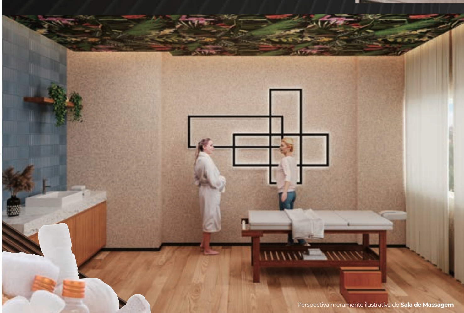
Perspectiva meramente ilustrativa do Sala de Massagem