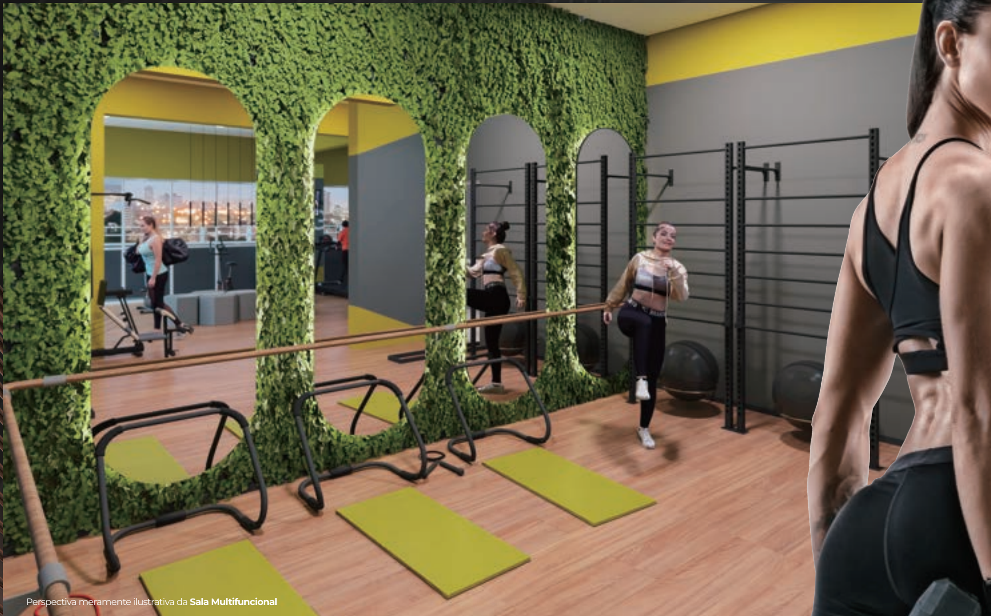
Perspectiva meramente ilustrativa da Sala Multifuncional