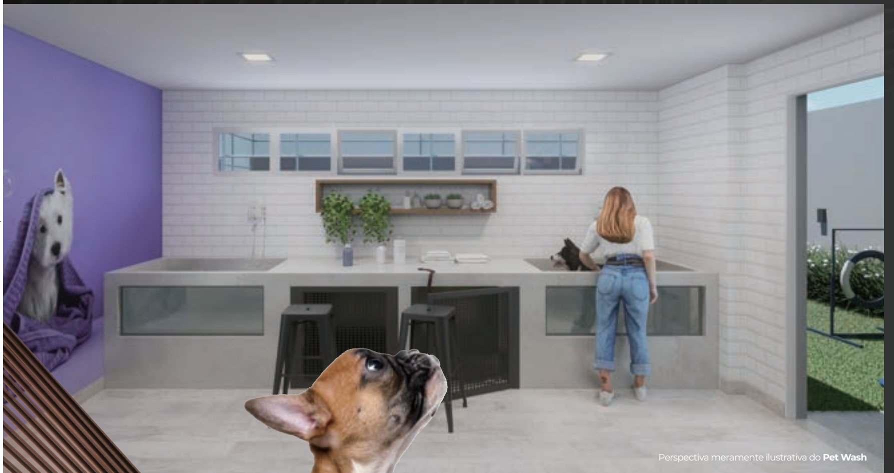
Perspectiva meramente ilustrativa do Pet Wash