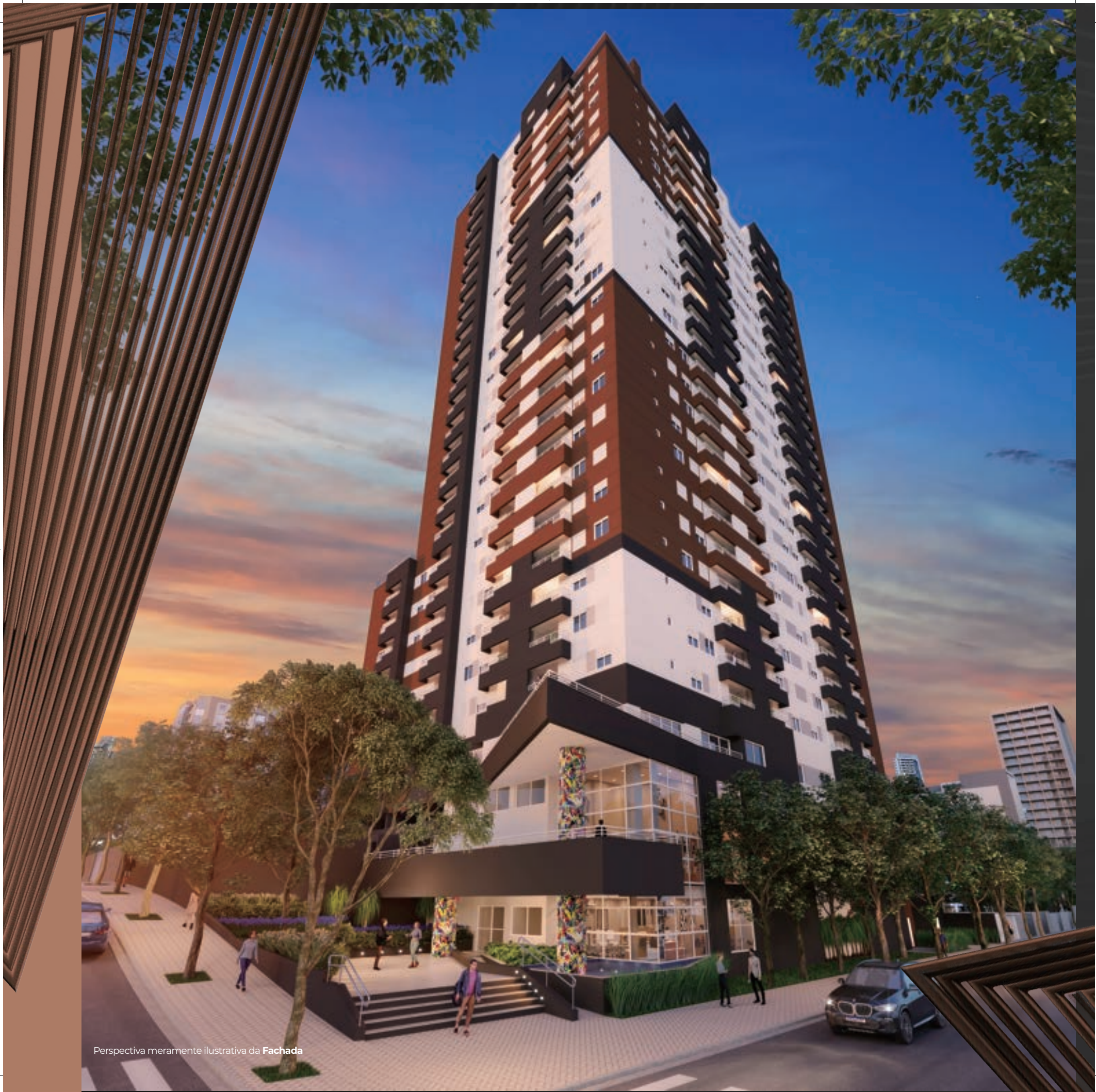
Perspectiva meramente ilustrativa da Fachada