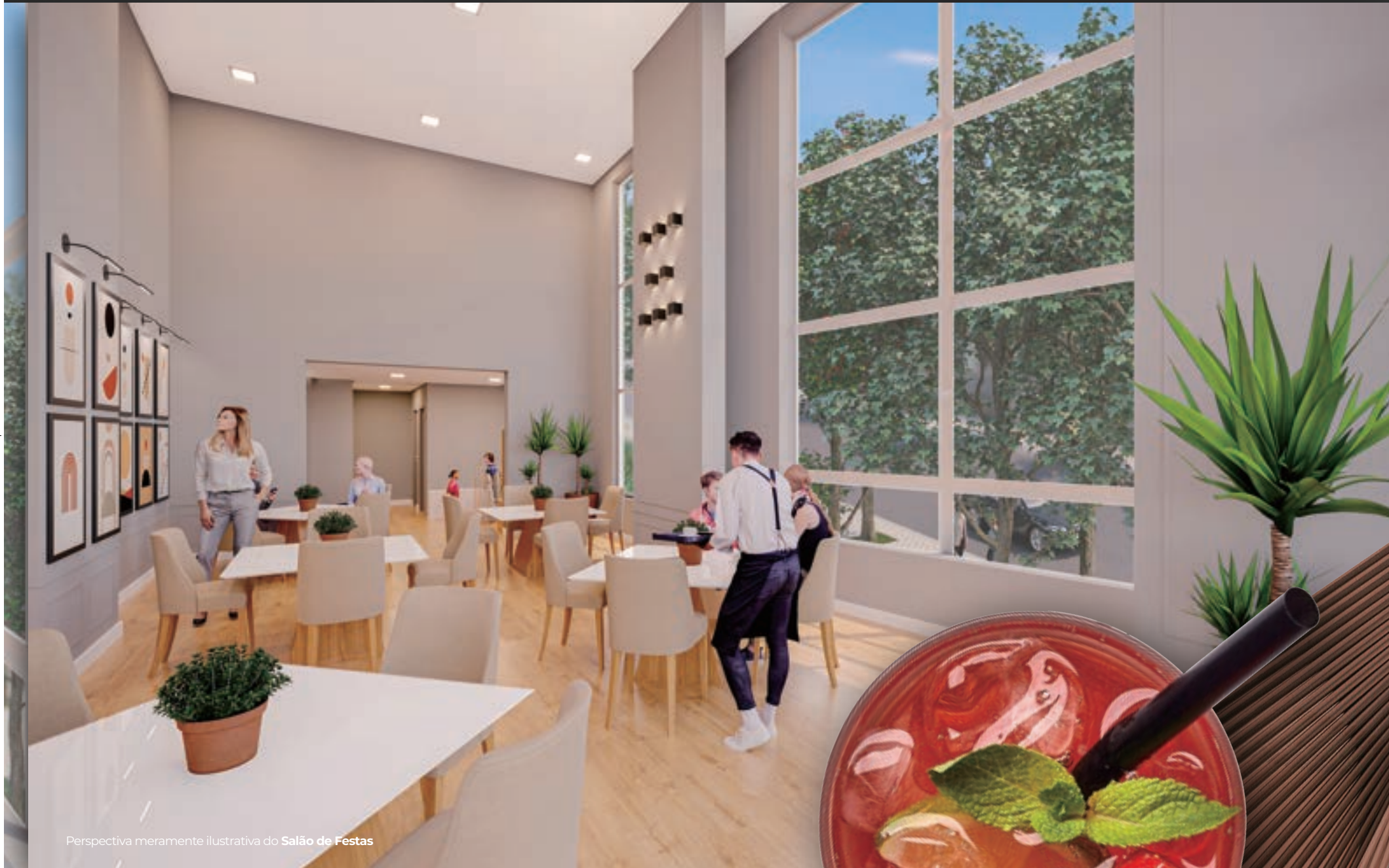
Perspectiva meramente ilustrativa do Salão de Festas