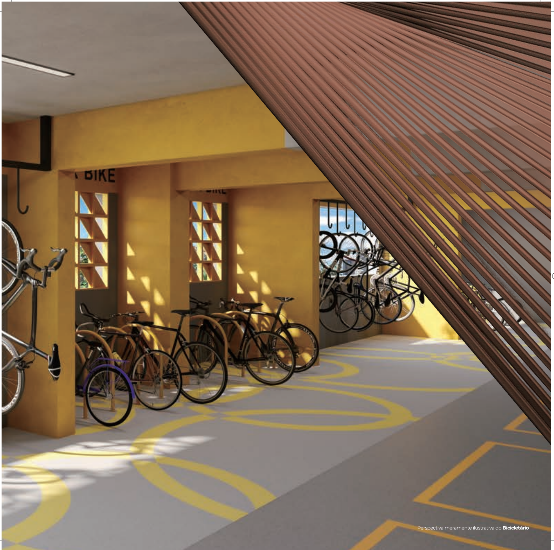
Perspectiva meramente ilustrativa do Bicicletário