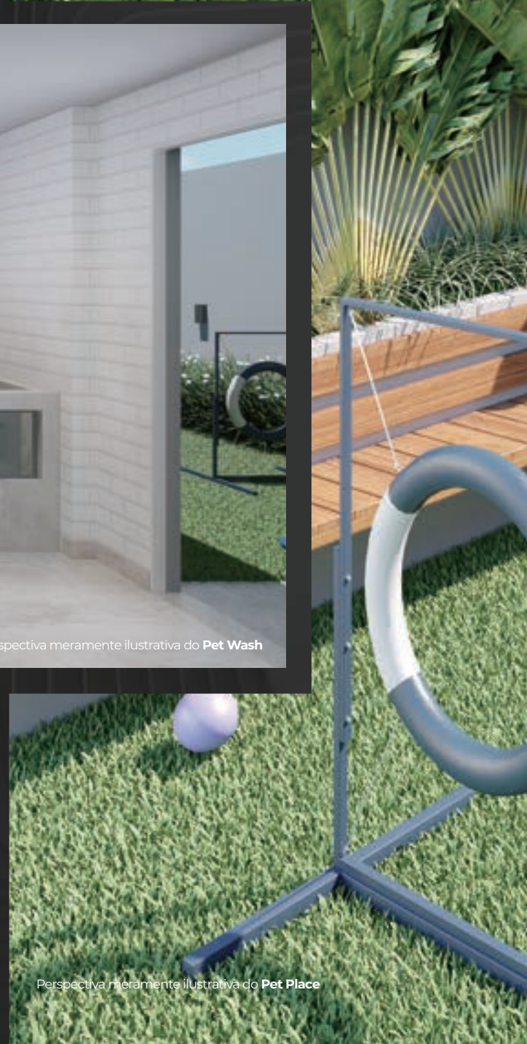
Perspectiva meramente ilustrativa do Pet Place