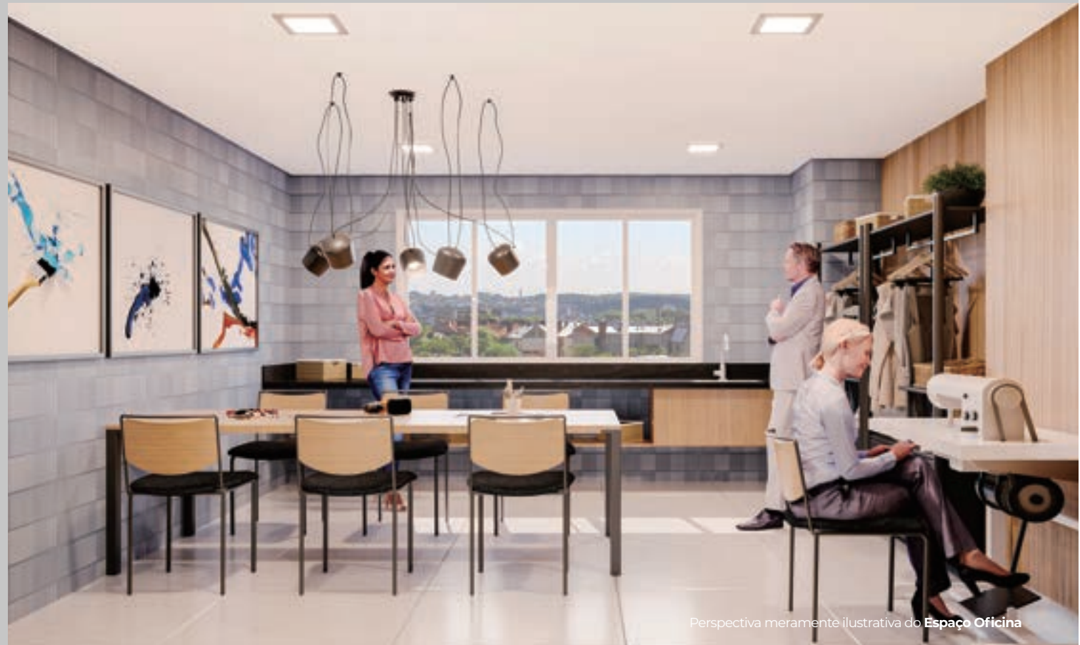
Perspectiva meramente ilustrativa do Espaço Oficina