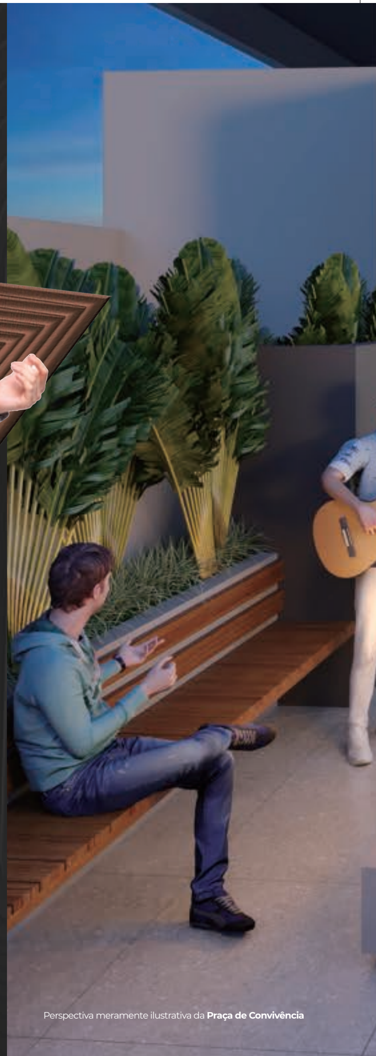
Perspectiva meramente ilustrativa da Praça de Convivência