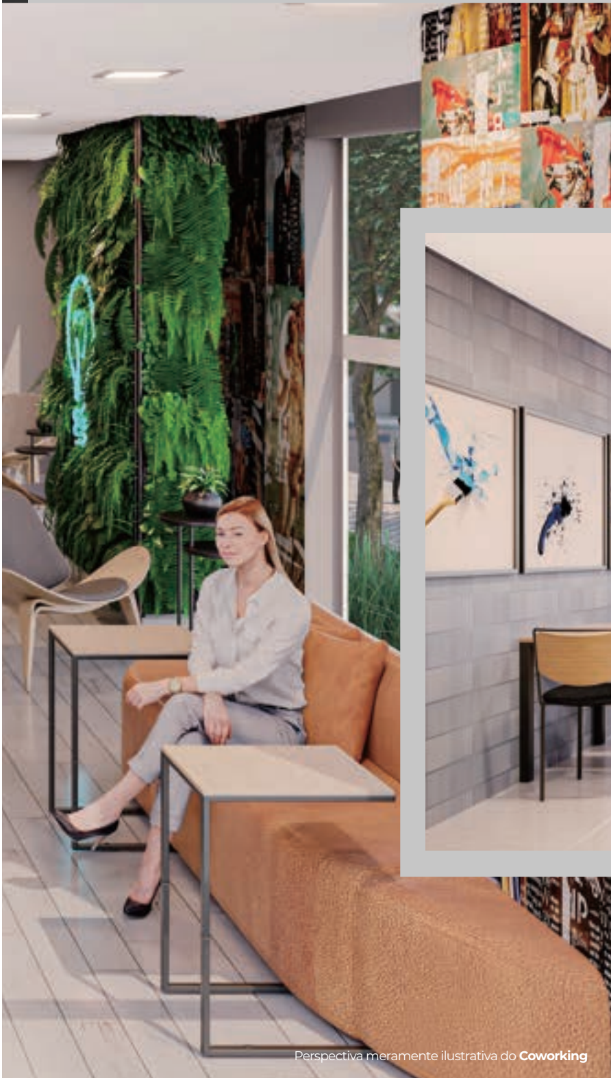
Perspectiva meramente ilustrativa do Coworking