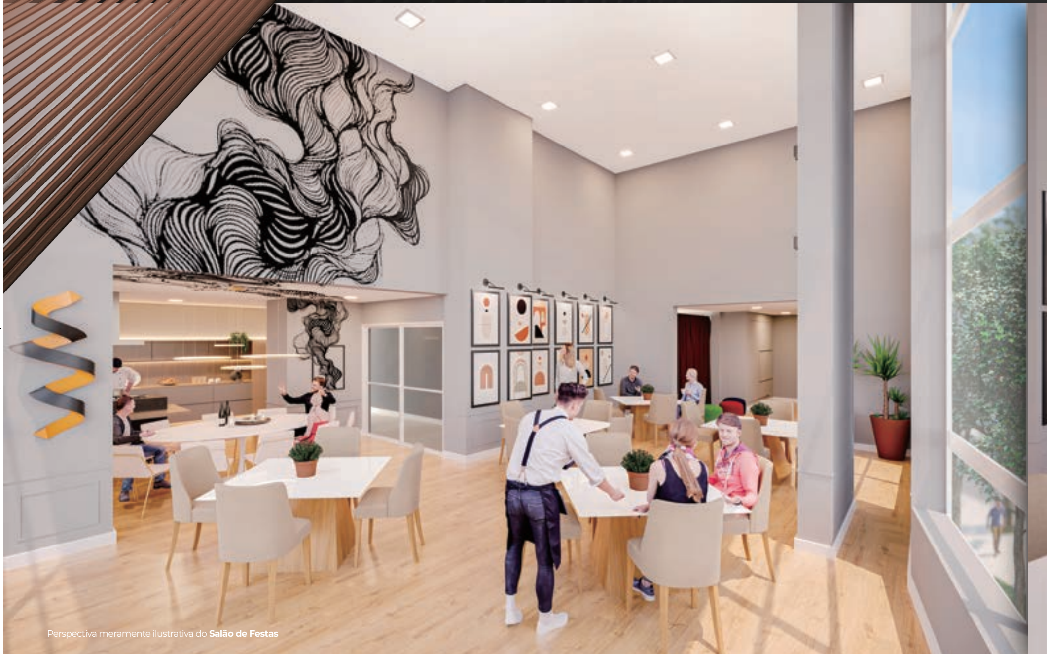
Perspectiva meramente ilustrativa do Salão de Festas